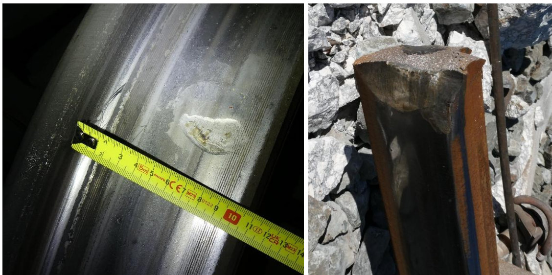
1: Muecas presentes en la rueda derecha del eje 13 del tren de Iryo (coche 4, primer eje del primer bogie) y posible punto de colisión con la cabeza del carril.

Las muescas tienen un patrón uniforme en los coches 2, 3 y 4 y son compatibles con un impacto en la cabeza del carril. La comparación visual entre las muescas de las ruedas y la sección de carril roto de la zona cero del descarrilamiento arrojan resultados presumiblemente coincidentes: