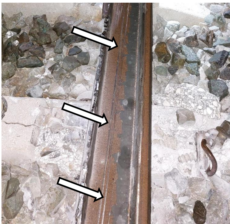
4: Carril tumbado hacia el exterior, tras el punto de rotura. Se observan en el alma del carril huellas de paso de ruedas del tren.