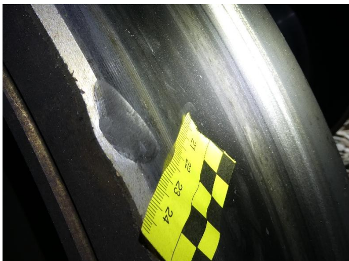
3: Muesca presente en la rueda derecha del eje 19 del tren de Iryo (coche 5, primera rueda, segundo bogie)

ellas. Estas muescas consisten en una marca en la zona exterior de la banda de rodadura, compatible con un impacto contra la cabeza de carril en una posición de no continuidad con la zona previa a la fractura. El hecho de que estas muescas se encuentren en el coche 5, y que el coche 6 fuese el primero descarrilado de la composición es compatible con que el carril se estuviese volcando hacia el exterior (lado derecho según el sentido de avance) durante el paso del coche 5, de manera que el coche 6 descarriló debido a una falta completa de continuidad en la rodadura.